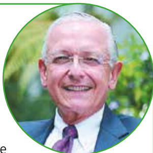
Augusto Solano Mejía Presidente

A pesar de los retos en clima, falta de luminosidad y alta competencia con otros países productores, los resultados del sector floricultor en Colombia entre enero y septiembre, de acuerdo con cifras del Dane, fueron positivos. En efecto, las exportaciones aumentaron 5.5% en valor y 6.7% en volumen, frente a igual periodo del 2017. Estados Unidos sigue siendo el principal destino de las exportaciones de Flores de Colombia®, con una participación en valor de 79% y 77% en volumen.