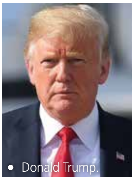
• Donald Trump.