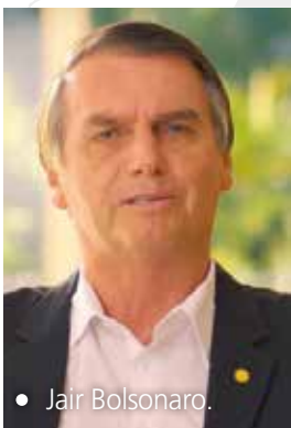
• Jair Bolsonaro.

El anuncio de Jair Bolsonaro, quien asumirá la Presidencia de Brasil el primero de enero próximo, de fusionar los ministerios de Agricultura y Medio Ambiente, ha despertado la preocupación entre ecologistas y otros sectores de la opinión, informó la agencia española EFE. Para Marina Silva, exministra de Medio Ambiente y excandidata presidencial, la fusión "Será un triple desastre. Estamos inaugurando la era trágica en la cual la protección ambiental es igual a nada. Apenas iniciado, el gobierno de Bolsonaro ya es un retroceso incalculable". Por su parte, Greenpeace Brasil dijo que "Los mercados internacionales y los consumidores quieren garantías de que nuestro producto agrícola no esté manchado con la destrucción forestal. Al extinguir el ministerio de Medio Ambiente, reduciremos el combate a la deforestación, perdiendo competitividad, lo que puede inclusive afectar la generación de empleos".