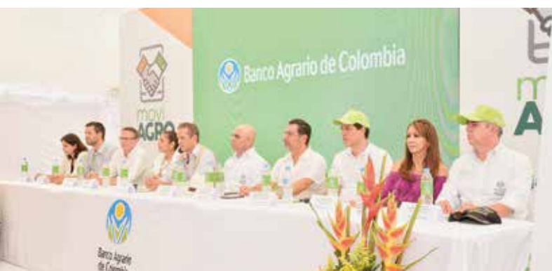
• En el lanzamiento de MoviAgro.

Los productores nos pueden pedir que los visitemos, también los podemos contactar cuando consultamos nuestras bases de datos, pueden llegarnos referidos o ellos pueden referir a otras personas o muchas veces también se establecen los contactos como resultado de las brigadas de crédito que realizamos a nivel nacional de forma regular. 🌱